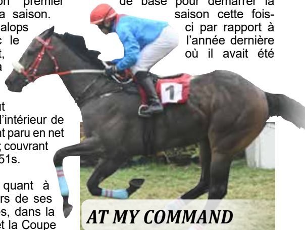
AT MY COMMAND

l'adage, la forme est temporaire mais la classe est permanente. Son entraîneur a été aux petits soins avec lui et il a passé beaucoup de temps au bord de la mer où il en a profité pour nager régulièrement. Il ne fait aucun doute qu'il a eu une meilleure préparation de base pour démarrer la saison cette fois-ci par rapport à l'année dernière où il avait été